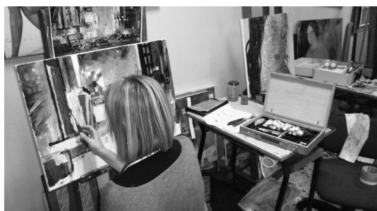
Corso di disegno e pittura, corsisti