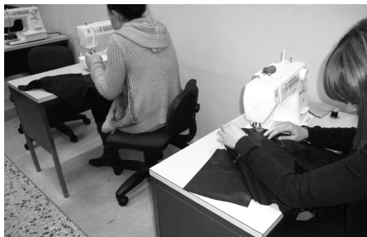
Corso di sartoria, corsisti